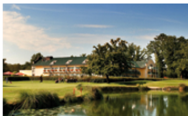
GUTSHOF PENNING Tel. +49 8532/9266-0 gutshof-penning@quellness-golf.com