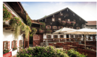
GUTSHOF UTTLAU Tel. +49 8535/189-0 gutshof-uttlau@quellness-golf.com