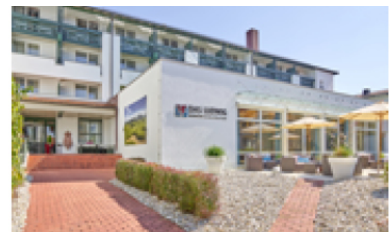
DAS LUDWIG**** Fit.Vital.Aktiv.Hotel Tel. +49 8532/799-0 dasludwig@quellness-golf.com

Die Gutshöfe im Resort stehen allen Golfliebhabern zur Verfügung, die in unmittelbarer Platznähe wohnen möchten und eine ungezwungene, familiäre Atmosphäre schätzen. Ob die modernen Suiten des Gutshof Penning, die bayerische Gastlichkeit des Gutshof Brunnwies oder die rustikale Herzlichkeit des 400 Jahre alten Gutshofs Uttlau – jeder Gutshof besticht durch seinen Charakter, seinen Charme und seine besondere Lage.