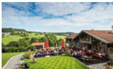
GUTSHOF BRUNNWIES Tel. +49 8535/9128-0 gutshof-brunnwies@quellness-golf.com

Die Gutshöfe im Resort stehen allen Golfliebhabern zur Verfügung, die in unmittelbarer Platznähe wohnen möchten und eine ungezwungene, familiäre Atmosphäre schätzen. Ob die modernen Suiten des Gutshof Penning, die bayerische Gastlichkeit des Gutshof Brunnwies oder die rustikale Herzlichkeit des 400 Jahre alten Gutshofs Uttlau – jeder Gutshof besticht durch seinen Charakter, seinen Charme und seine besondere Lage.